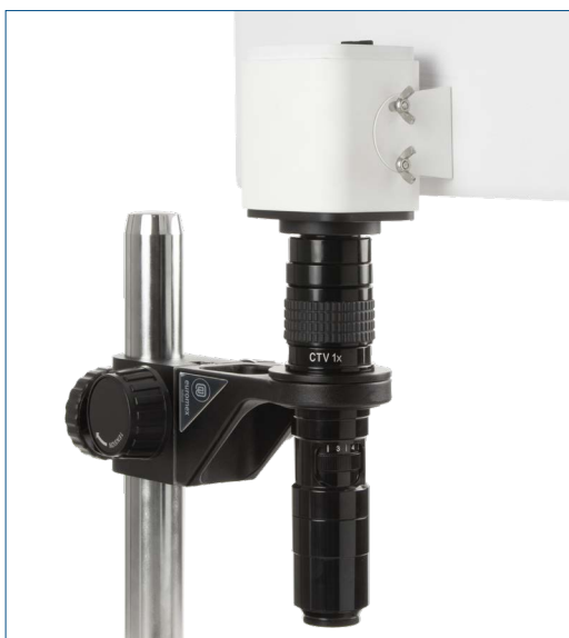
● El MZ.4500 en combinación con la cámara VC.3036-HDS