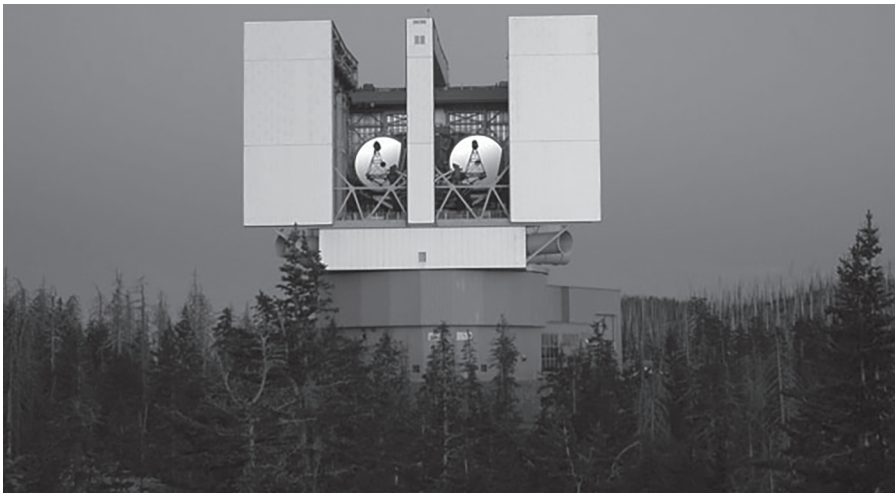
Abbildung 1.3: Das Large Binocular Telescope (LBT) im Observatorium in Arizona, USA

Radioteleskope und andere Arten von Teleskopen arbeiten in allen Bereichen des elektromagnetischen Spektrums – weitere Einzelheiten dazu finden Sie in Kapitel 4.